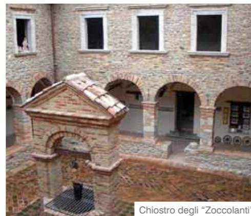
Chiostro degli "Zoccolanti"

L'anima fiera della popolazione è testimoniata an-